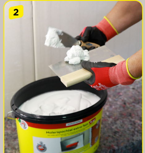
2 Der Malerspachtel extra fein „to go“ ist gebrauchsfertig. Einfach den Eimer öffnen und die Spachtelmasse entnehmen.