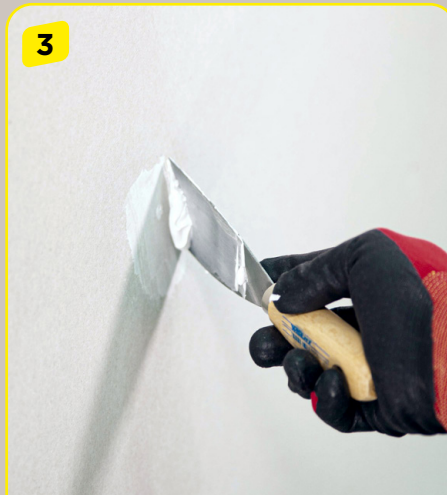
3 Die Spachtelmasse wird mit einem geeigneten Spachtelwerkzeug auf die zu füllende Fläche aufgetragen.