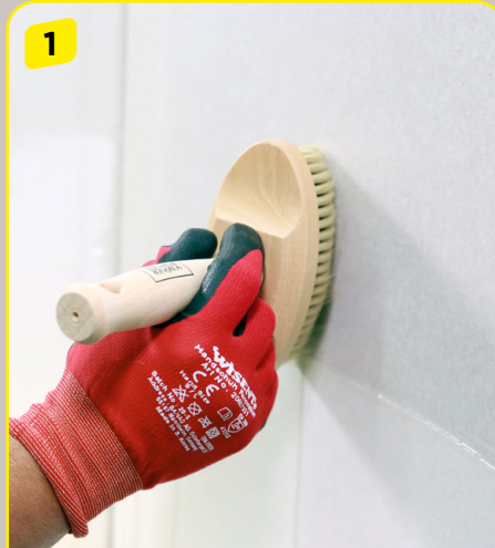
1 Die Wand muss frei von Staub und losen Teilen sein. Am besten grundiert ihr dazu die Fläche, z. B. mit dem Universal Tiefgrund LF.

Gut zu wissen: Ihr könnt den Malerspachtel extra fein „to go“ auch für die Verspachtelung von Fugen und für die vollflächige Wand- oder Deckenverspachtelung verwenden.